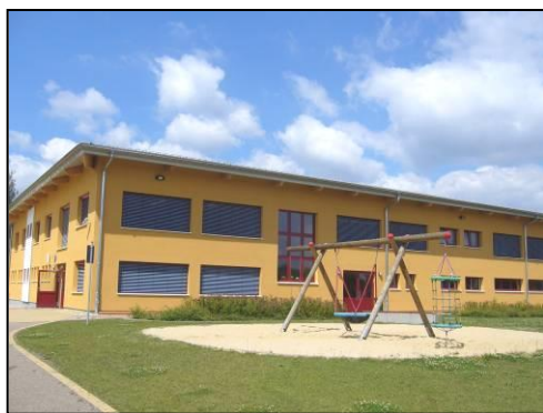
Serbskŕ zakłŕadna ŕula Raabicy